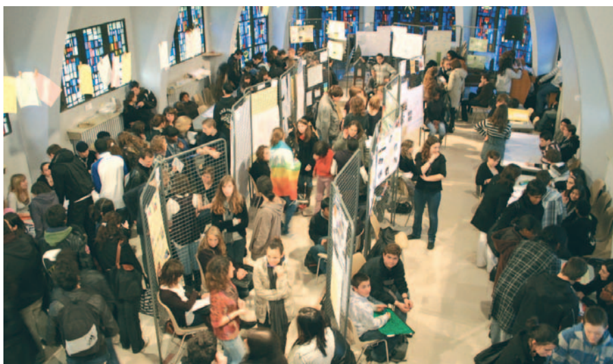
Écoliers, collégiens et lycéens du Saint-Rosaire, à Sarcelles, ont animé leur « festival de l'engagement ».

Dans nombre d'établissements, un portrait-mosaïque géant de saint Jean-Baptiste de La Salle a été réa-