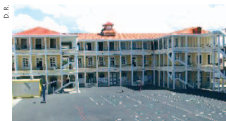
Le séminaire-collège Sainte-Marie, à Fort-de-France.