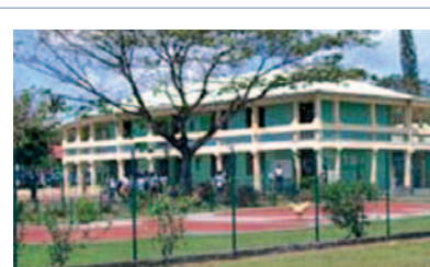
L'école Massabielle, à Baie-Mahault.