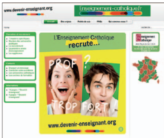
1. À l'adresse www.devenir-enseignant.org